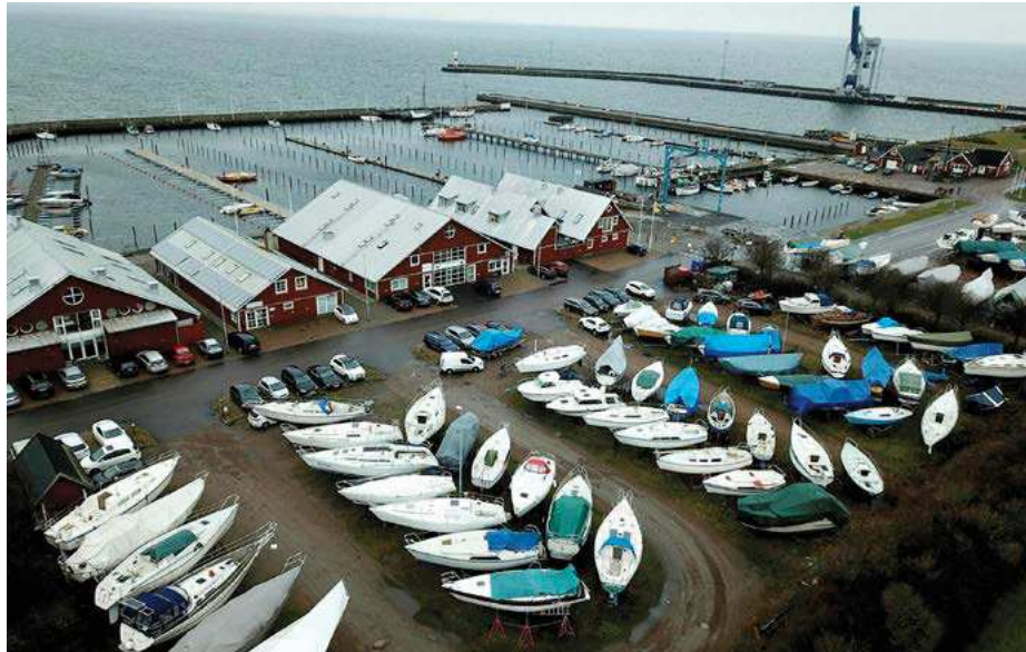
Hamnen i Höganäs står i fokus för medborgardialog. Nu vill kommunen ha in synpunkter från kommuninvånarna om vad man vill se för utveckling. Fram till den 18 mars pågår dialogen.

– Vi hoppas få in en bredd i förslagen, tankar och idéer. Vi tycker olika om vad hamnen ska användas till